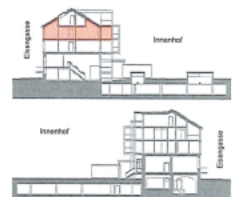
Schnitte stellen die Lage der Wohnung im Objekt dar.